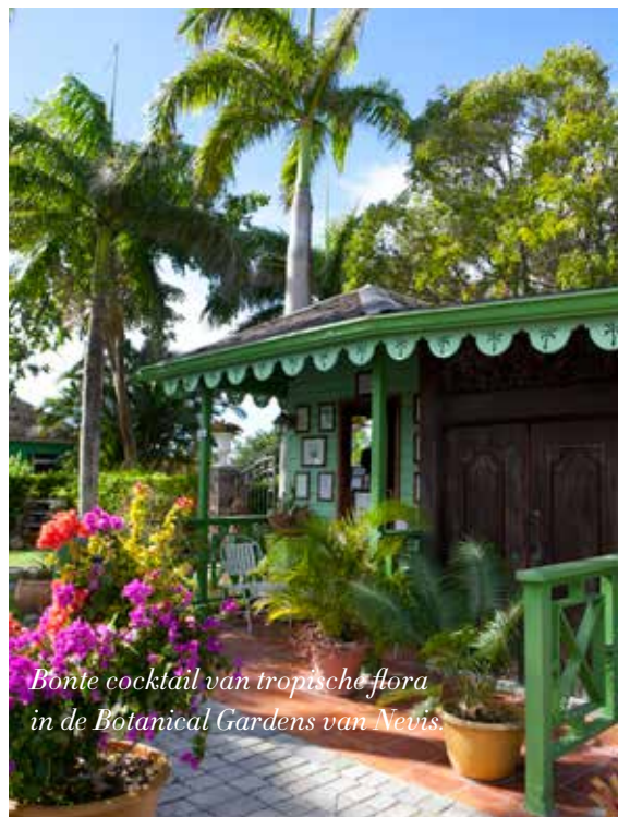
Bonte cocktail van tropische flora in de Botanical Gardens van Nevis.