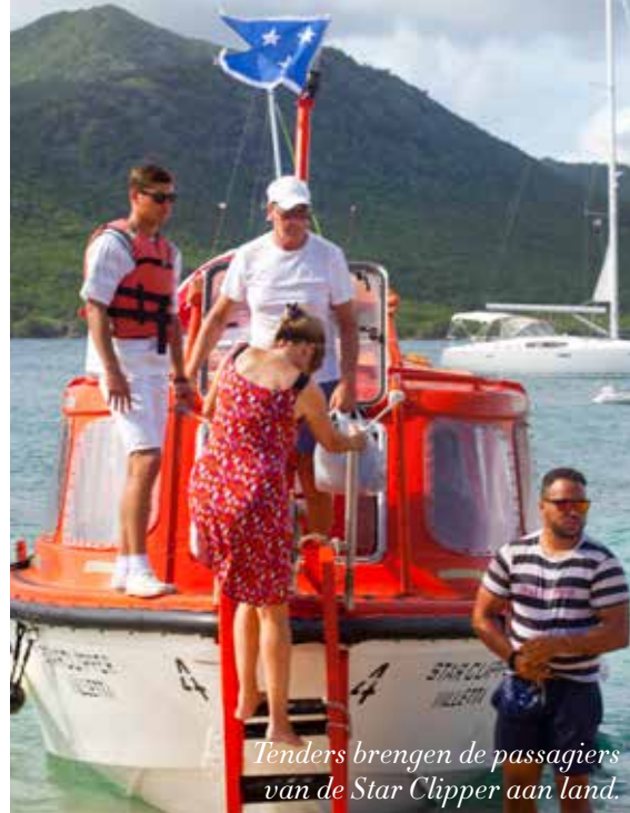
Tenders brengen de passagiers van de Star Clipper aan land.