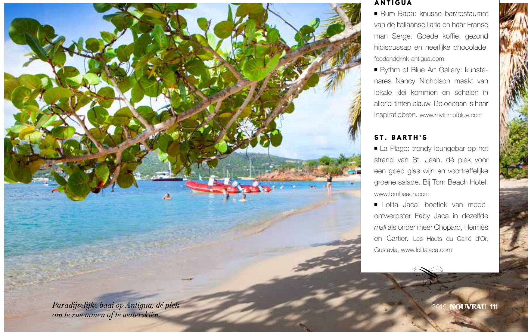
Paradijselijke baai op Antigua; dé plek om te zwemmen of te waterskiën.