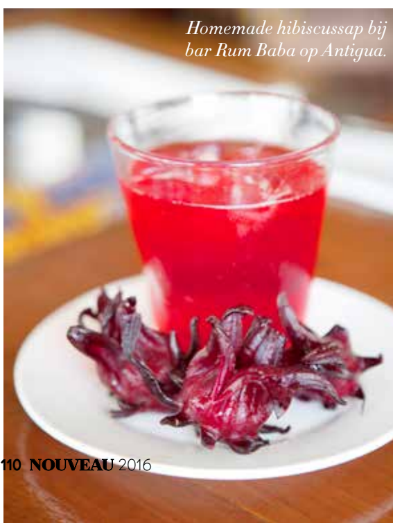
Homemade hibiscussap bij bar Rum Baba op Antigua.