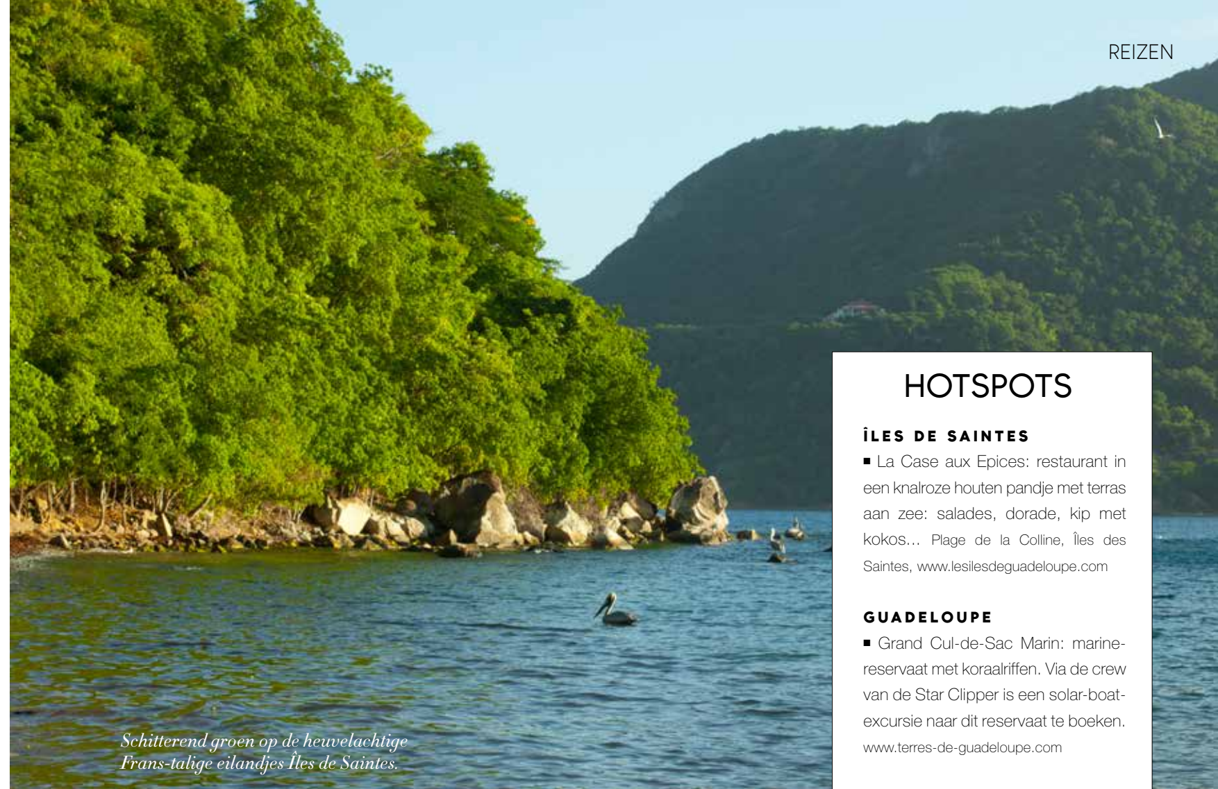
Schitterend groen op de heuvelachtige Frans-talige eilandjes Îles de Saintes.