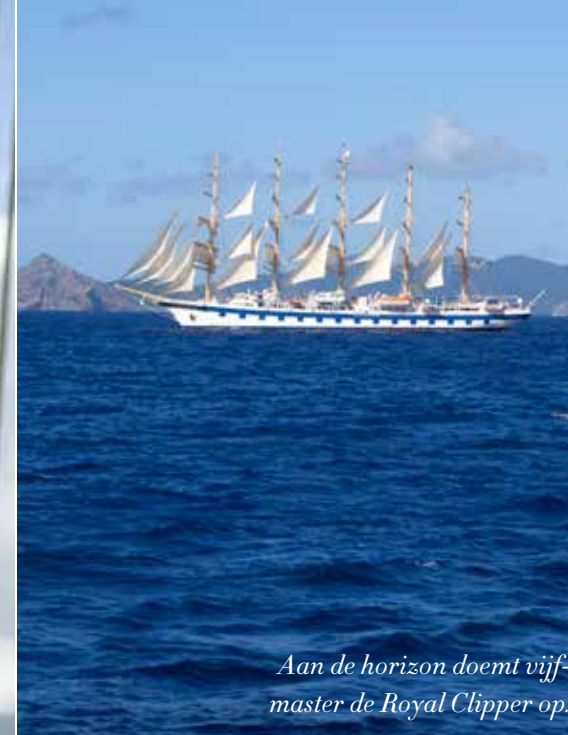
Aan de horizon doemt vijf- master de Royal Clipper op.