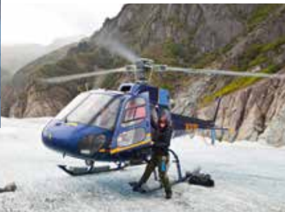
De helikopter van pilote Tracy.

De zee is onwerkelijk kalm als de zon rond een uur of zes langzaam boven de horizon rijst. Het schip glijdt over het water, terwijl de hemel achter de besneeuwde bergtoppen oranje kleurt. Het loont om zo vroeg aan dek te zijn, want bij het ochtendgloren duiken er bulrugwalvissen op! Ze spuiten fonteintjes en gooien hun staart in de lucht om