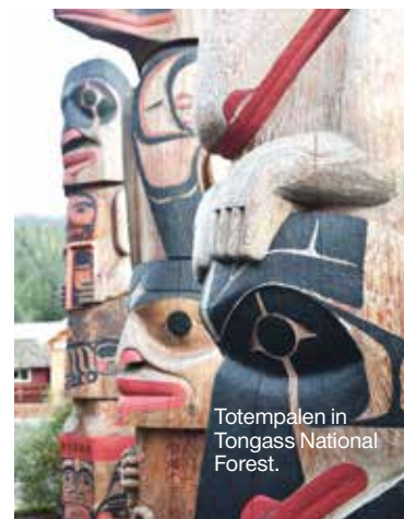
Totempalen in Tongass National Forest.

Meer dan honderd jaar oude tuinen nabij Victoria in weelderige Britse stijl. Het hele jaar geopend. 800 Benvenuto Avenue, Brentwood Bay, butchartgardens.com