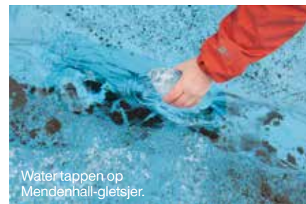
Water tappen op Mendenhall-gletsjer.