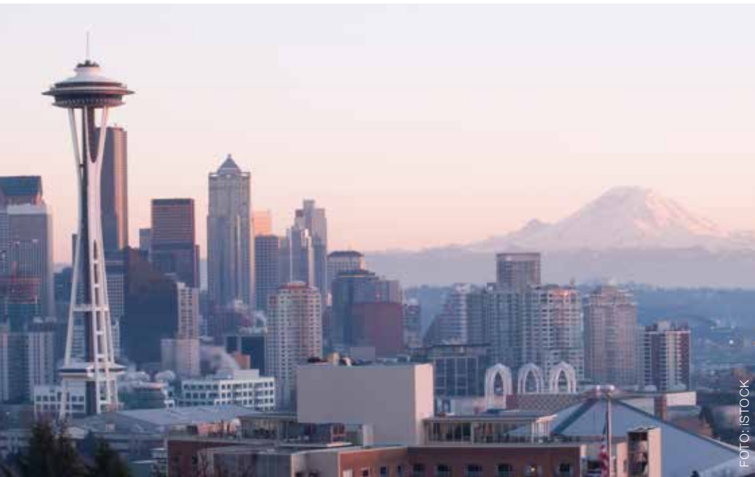
De skyline van Seattle met op de achtergrond Mount Rainier.