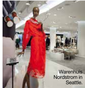
Warenhuis Nordstrom in Seattle.

Mode, schoenen en tassen van de crème de la crème van internationale ontwerpers. Van Dries Van Noten tot Christian Louboutin. 600 Pine Street, barneys.com