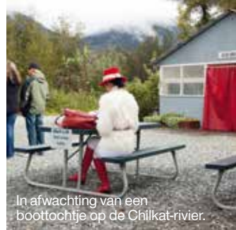
In afwachting van een boottochtje op de Chilkat-rivier.