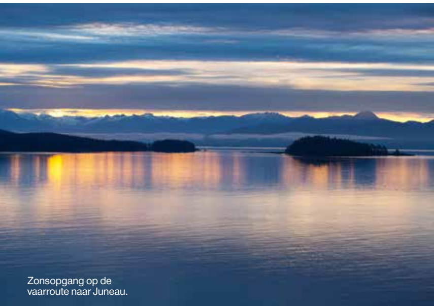
Zonsopgang op de vaarroute naar Juneau.