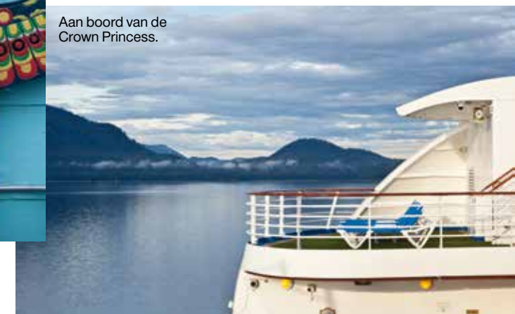
Aan boord van de Crown Princess.