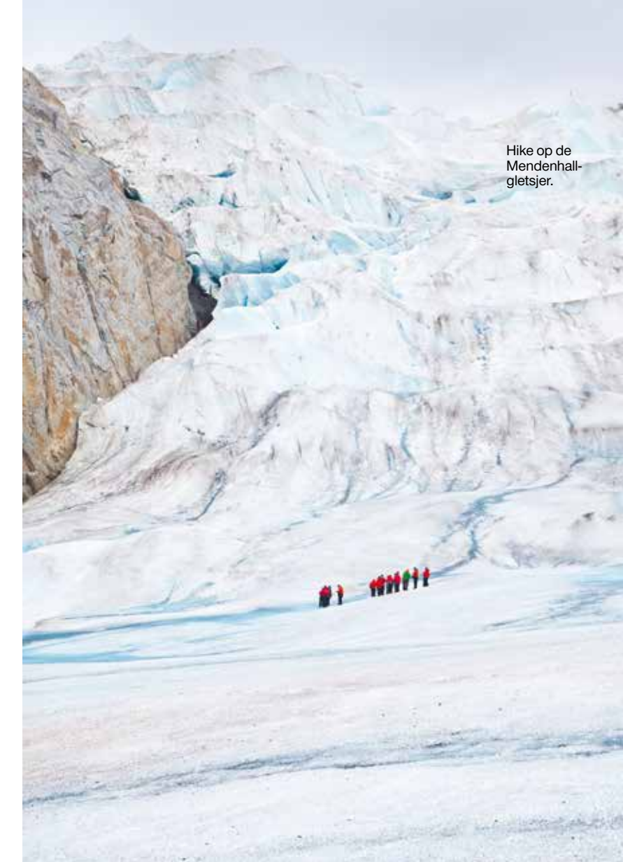
Hike op de Mendenhall-gletsjer.

krachtiger de uitstraling!’ Na een rondwandeling door Haines nemen we deel aan een excursie naar de afgelegen wildernis van Bald Eagle Preserve. We rijden over Haines Highway, een ‘snelweg’ zonder files, want zo dunbevolkt is dit gebied. De weg voert langs puntige bergen waar mistflarden omheen hangen. Aangekomen in het reservaat maken we een boottochtje op de Chilkat-rivier. De zon breekt door en het wordt een schitterende tocht langs imposante Alaska State Trees, oftewel sitkasparren. In de rivier zwemmen veel soorten zalm en dat betekent dat we goede kans hebben beren te zien, volgens de bestuurder van het motorbootje die oogt als een ruige goud-