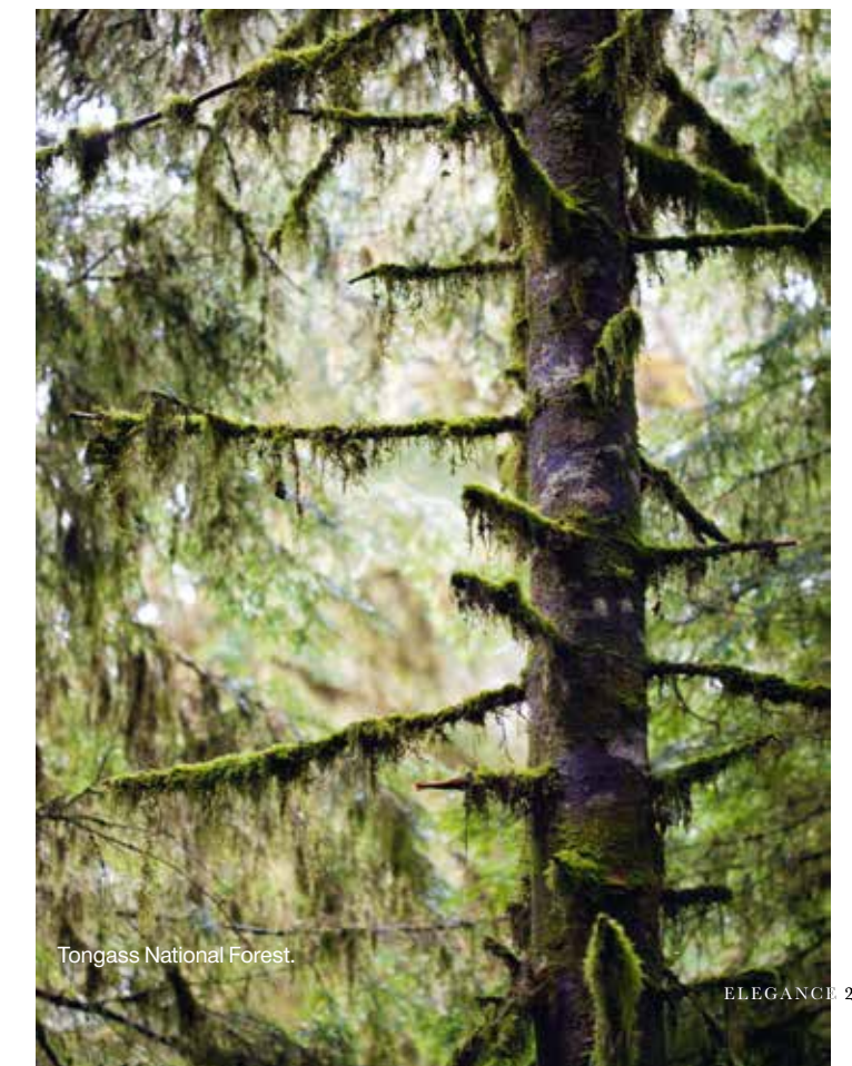
Tongass National Forest.

stad Victoria. Hét icoon van deze Canadese stad is The Empress uit 1908. Aan grandeur heeft dit klassieke hotel nog niets ingeboet, maar tegelijk blijkt het een hippe hotspot te zijn, waar een jazzband die avond voor veel sfeer zorgt. Dan is het tijd om terug aan boord te gaan en onze koffers te pakken. Vroeg in de morgen varen we de cruisehaven van Seattle binnen en komt er een einde aan dit ijselijk geweldige avontuur.