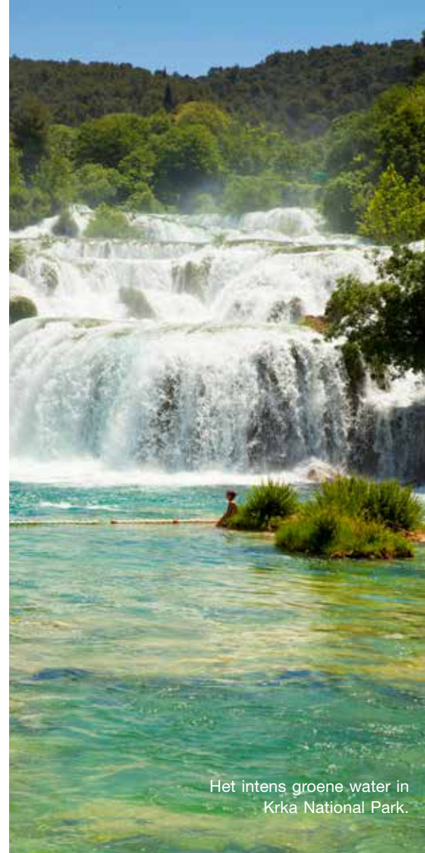
Het intens groene water in Krka National Park.

'ze was welbeschouwd de eerste celebrity hier'