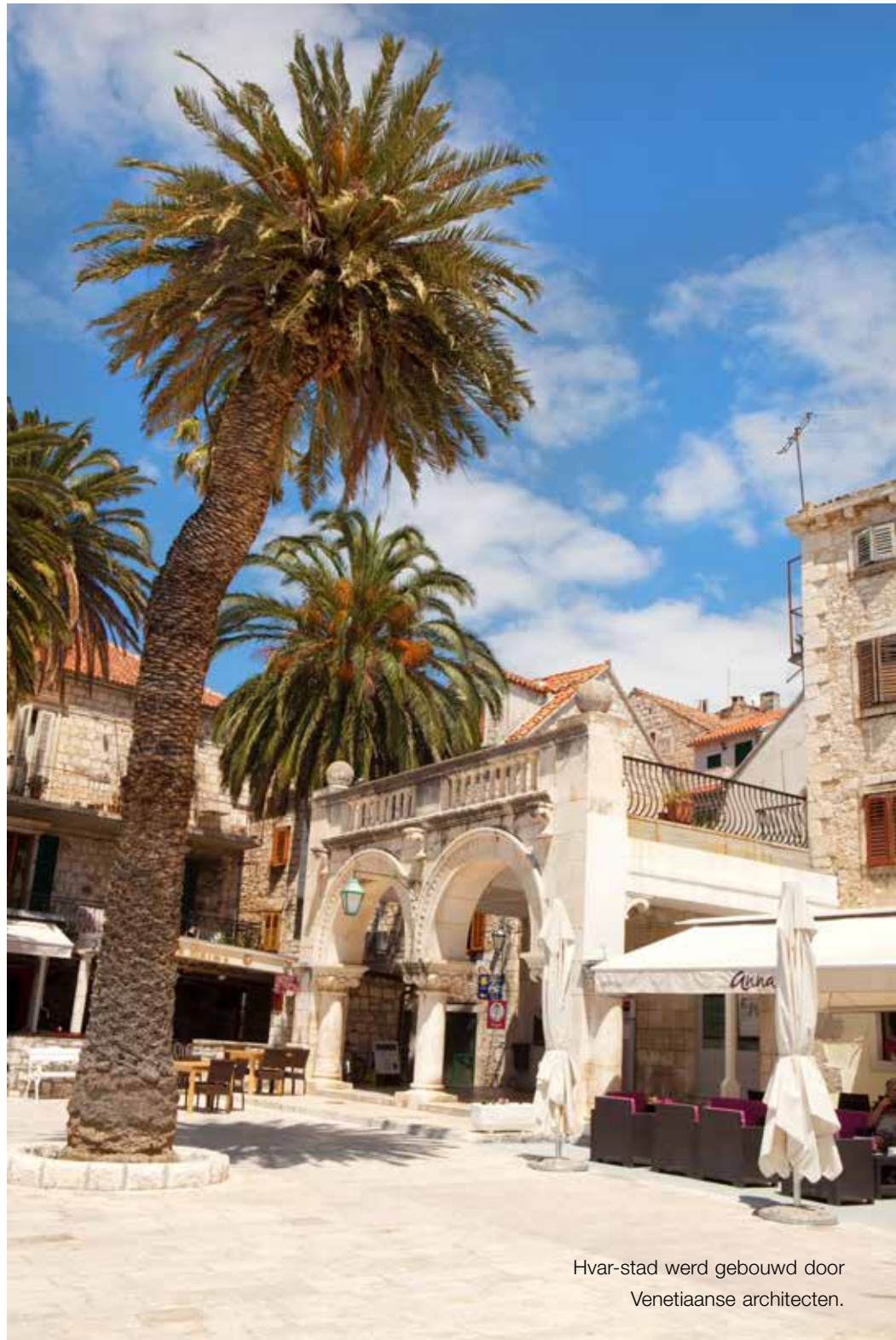
Hvar-stad werd gebouwd door Venetiaanse architecten.