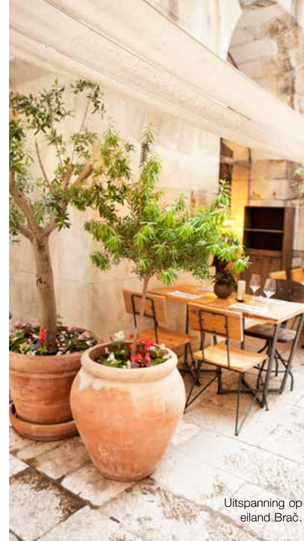
Uitspanning op eiland Brač.