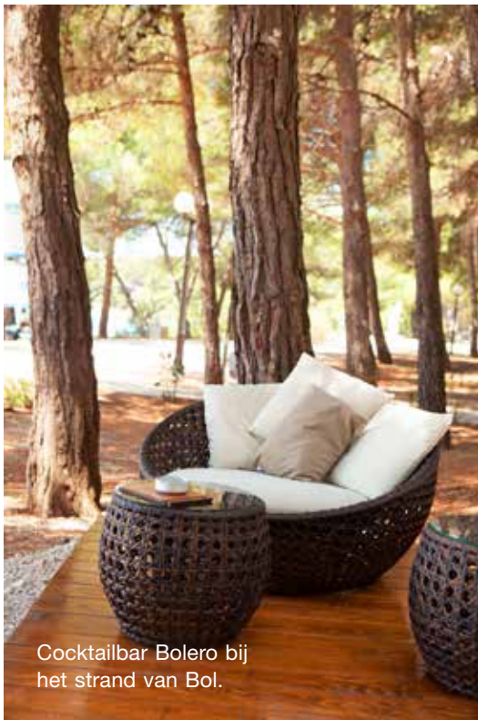
Cocktailbar Bolero bij het strand van Bol.