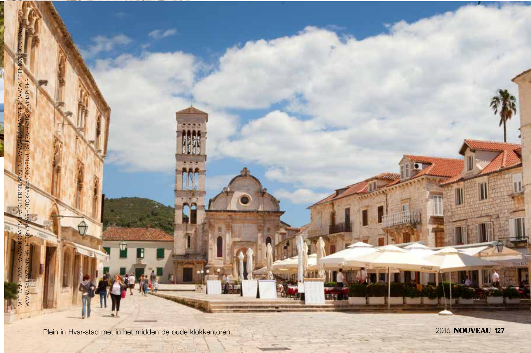
Plein in Hvar-stad met in het midden de oude klokkentoren.